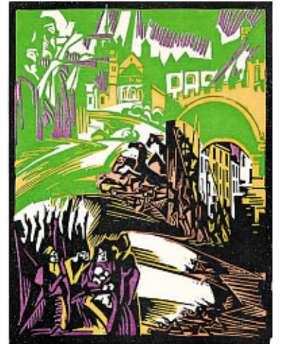
Henri Jonas, La Prophétie de Joel, kleurenhoutsnede, z.j., nummer 39/200.