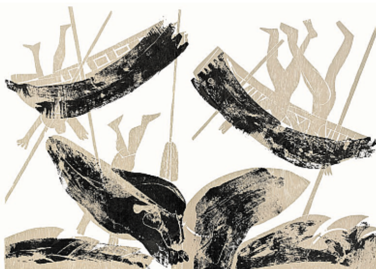
HAP Grieshaber, Wal kentert Boote (Walvissen kenteren boten), tweekleuren-houtsnede, 1974.

De tentoonstellingen in Fochteloo zijn gratis toegankelijk en de beide nieuwe cahiers kosten samen slechts tien euro en dat is allemaal mogelijk door bijdragen van Cultuurfonds Friesland, Stichting Bercoop Fonds, het Gé Kok Foons, PJ Fondation, een gift van een particulier en natuurlijk nu eveneens mogelijk door de structurele subsidie van de gemeente Ooststellingwerf.