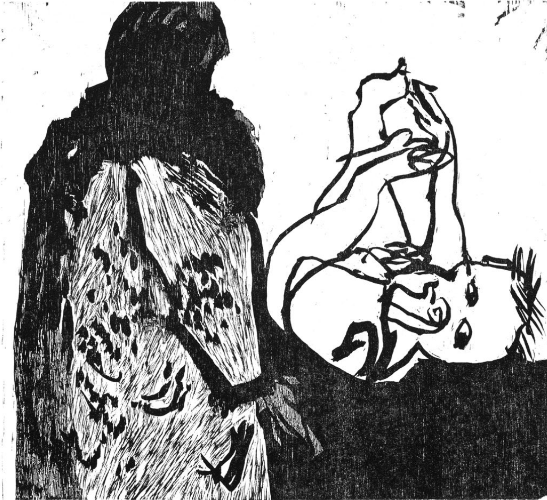
Manuel Kurpershoek, Jeroen en Karin, houtsnede (triplex), 1985, 280 x 300 mm, no. 8/20.