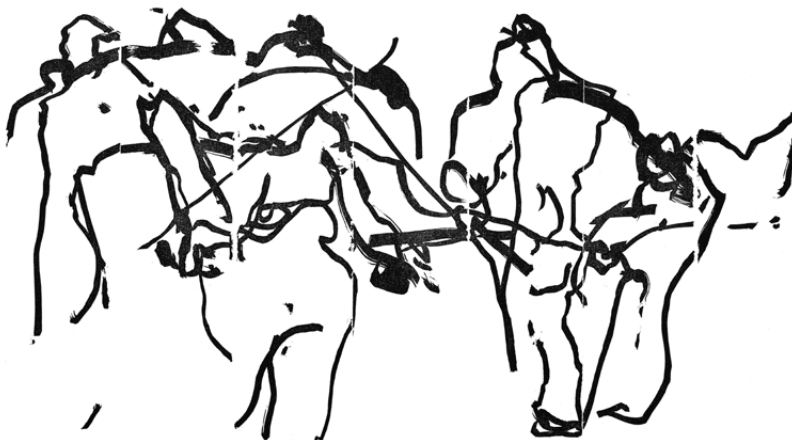
Manuel Kurpershoek, Billart , 10 over rood, lino, 1996, 300 x 700 mm, no. 2/3.